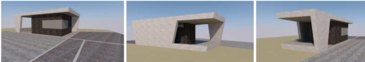
Geplanter Info-Point am Parkplatz zur Kirche in Vill